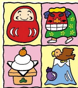
縁起物集めてみました

27日（金）14時～ 15分程度 保育士さんと一緒に遊んでみませんか？ 手遊びや、簡単工作等等、色々な遊びを みんなで楽しめます。どうぞお楽しみに～